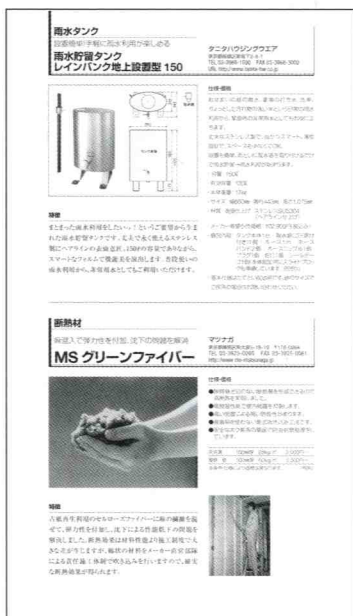
エコ素材図鑑(サンプル)